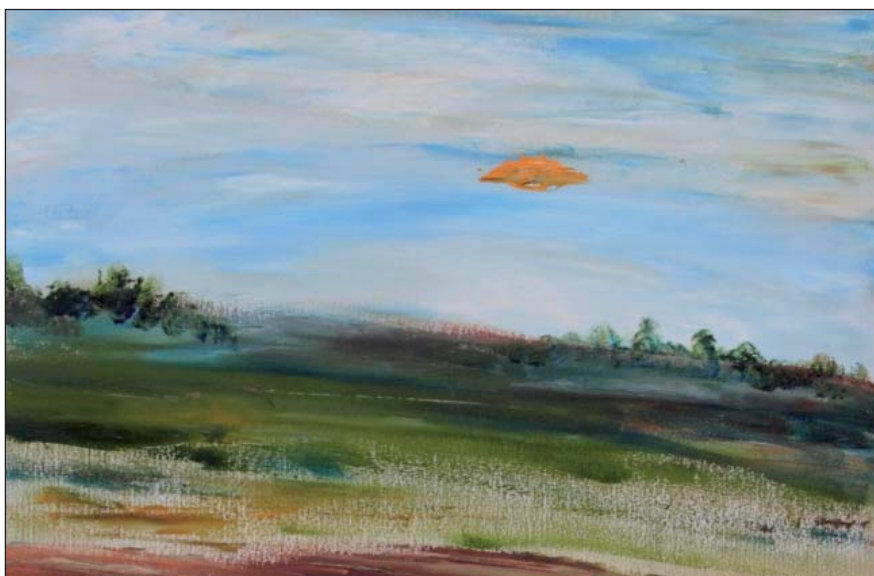
По бездорожьям королевства...