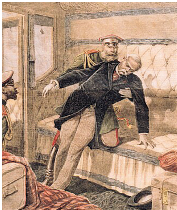
Смерть А.Б. Лобанова-Ростовского в поезде. Обложка «Le Petit Journal», Париж, 13 сентября 1896 г.

«Исполнение сей просьбы, с нашей точки зрения, было бы, однако, неудобно по следующим соображениям: 1) охрана короля русскими корпусами в самом дворце кажется нам несовместимым с принципами корейской независимости; 2) это может вызвать явное негодование других держав, в особенности Японии, и усложнить, таким образом, политическое положение Кореи... В то же время я снесся с японским правительством, чтобы заручиться его обещанием воздерживаться от всяких враждебных действий против корейского государя, и на это последовал вполне благоприятный ответ».