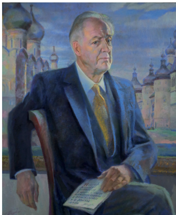
Портрет Н.Д. Лобанова-Ростовского, кисти Георгия Шишкина

Смитсоновский институт и Национальная галерея в Вашингтоне. Последняя первоначально принадлежала казначею Мелону, который в советские времена покупал у Эрмитажа живопись. Чтобы замять дело против него за злоупотребление госсредствами, он подарил стране основанный им музей, который впоследствии был переименован в «Национальную галерею». Соединенным Штатам 242 года. Но количество объектов мирового культурного достояния в Штатах превышает количество таковых в Англии, основанной 1100 лет тому назад (937 г.). Это обстоятельство объясняется двумя факторами: 1) в США никогда не было налога на ввоз/вывоз антиквариата и искусства; 2) американские олигархи, в отличие от российских, в начале XX века вкладывали свой капитал в индустриализацию страны и закупку антиквариата и искусства в широком масштабе в Европе, включая демонтаж замков во Франции и Италии и их перевозку и переустановку в штатах Нью-Йорк и Калифорния. Вышеуказанное наводит на мысль, что в будущем музеи и культурные мероприятия вне РФ будут финансироваться главным образом меценатами, а не государством.