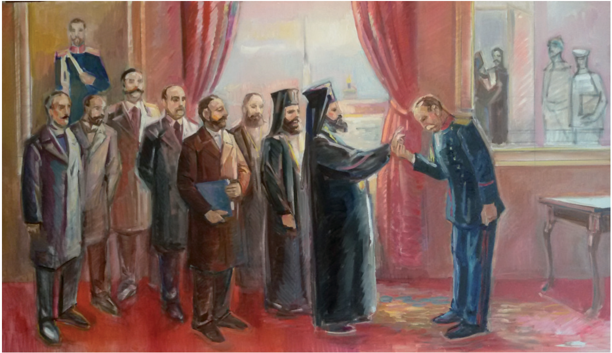
Болгарских послов принимает князь А. Б. Лобанов-Ростовский

Россией как со своей освободительницей и признанной покровительницей и защитницей славянских народов. Летом 1895 г. в Санкт-Петербург приехала болгарская делегация во главе с митрополитом Климентом Тырновским, встретившая у Государя российского самый милостивый прием. И тогда же, после десятилетнего отлучения, было официально объявлено, что этот прием оказывает «болгарскому народу, в чувствах которого Россия никогда не сомневалась».