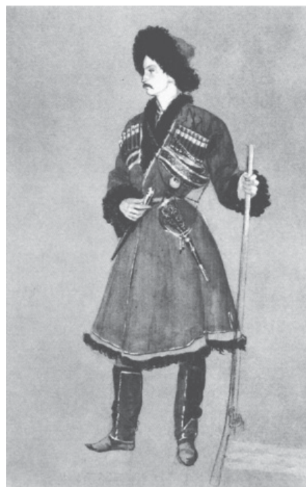
М.Б. Лобанов-Ростовский в первые годы службы на Кавказе (ок. 1843). Худ. Г.Г. Гагарин. Портрет хранится в Государственном Русском музее в Санкт-Петербурге.

Отмечены этапы его образования и карьеры, среди которых: «выпускник Царскосельского лицея с золотой медалью»;