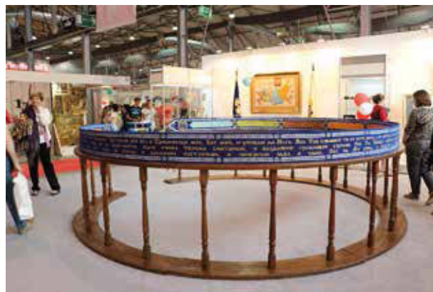
Музей «Дом Пояса Пресвятой Богородицы»