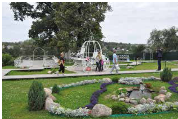
Парк Любви и Счастья