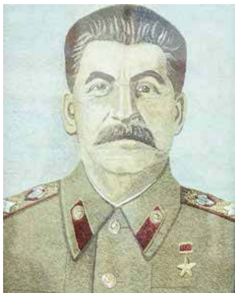
Панно «Портрет Сталина»

Точно такая же участь ожидала и золотошвейный промысел в Торжке. Но, слава богу, удалось избежать разора, произошло главное чудо.