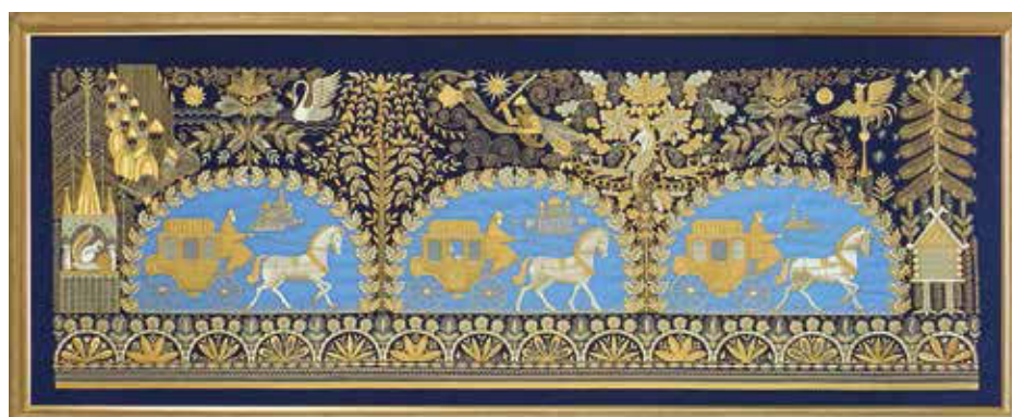
Панно «Путешествие из Петербурга в Москву»