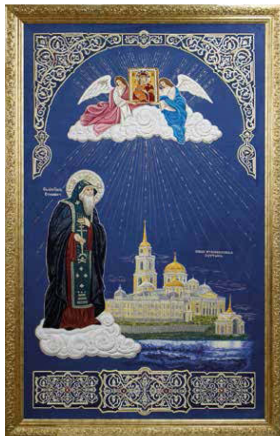
Панно «Нило-Столобенская пустынь»