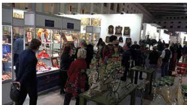
Изделия золотошвей на выставке «Уникальная Россия»