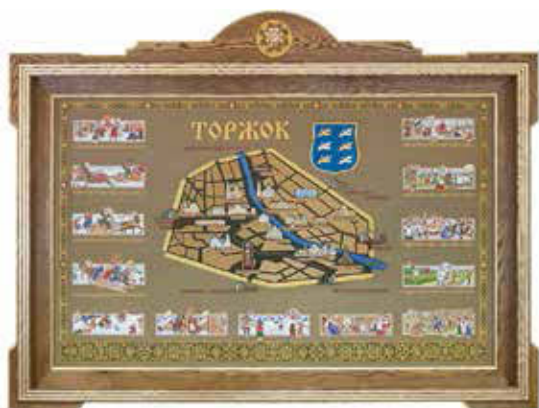
Панно «Земля Новоторжская»